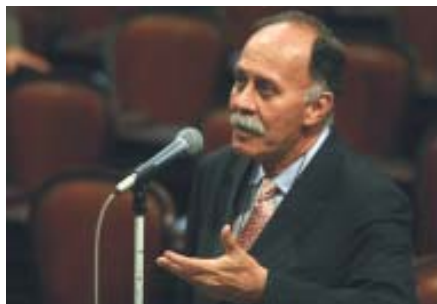
Deputado Paulo Ramos discursando na Assembleia Legislativa

Desde então, Paulo Ramos vem atuando na Assembleia Legislativa do Rio (Alerj) em defesa da definição dos pisos salariais para contadores, técnicos em contabilidade e outras categorias profissionais. Finalmente, a proposta foi